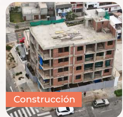
Edificio Miramare 2025