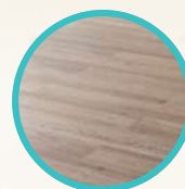
PISO SIMIL MADERA