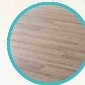
PISO SIMIL MADERA