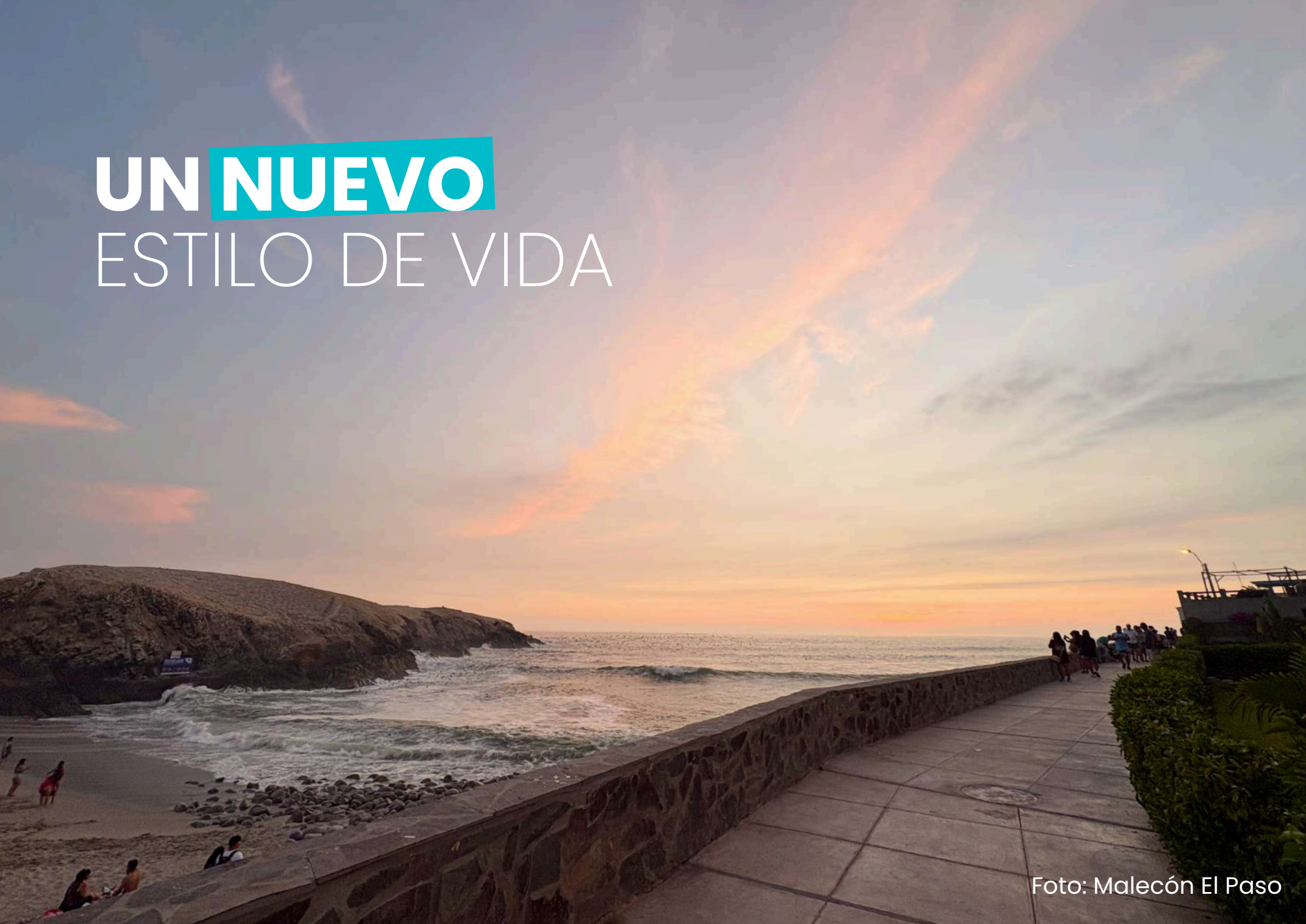
Foto: Malecón El Paso